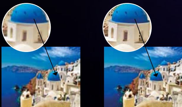
Zonder Super Resolution