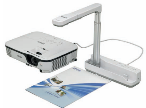
Le visualiseur de documents ELPDC06 permet de partager des objets et des documents.