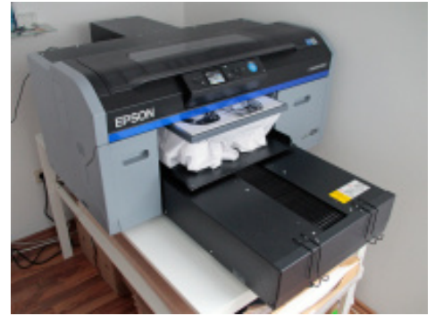
Das T-Shirt wird vom Epson SureColor SC-F2100 mit einem individuell gestalteten Motiv des Designers veredelt.

WERNER GRAPHICS e.U. Hauptstrasse 10 AT-2231 Strasshof an der Nordbahn Telefon: +43 (0)2287 / 40 444 -0 Website: www.wernergraphics.at E-Mail: office@wernergraphics.at