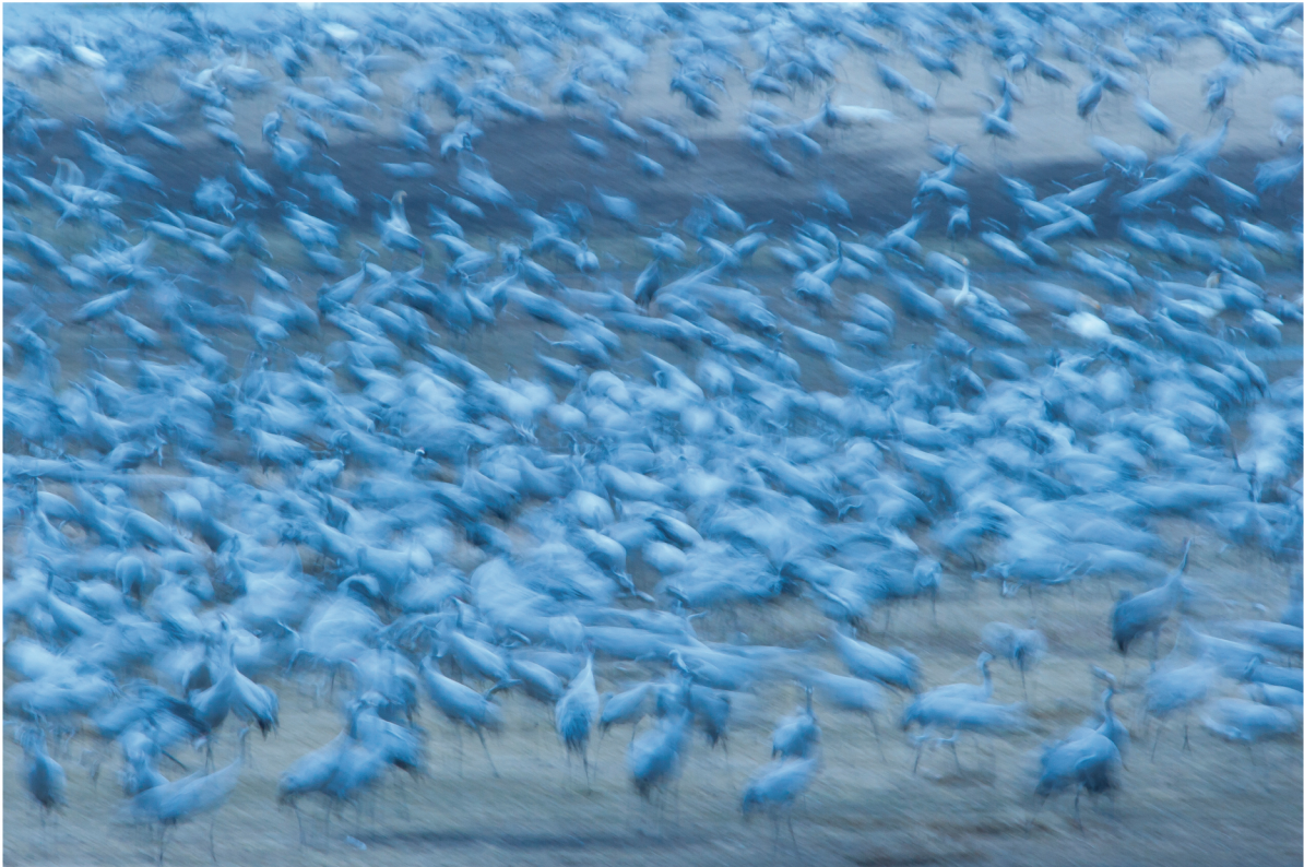
Gru cenerine ( Grus grus ) | Hornborga - Svezia