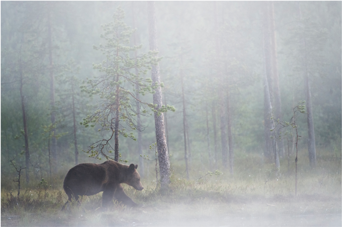
Orso bruno ( Ursus arctos ) | Vartiuss - Finlandia

MARZO 2013 | 1 2 3 4 5 6 7 8 9 10 11 12 13 14 15 16 17 18 19 20 21 22 23 24 25 26 27 28 29 30 31