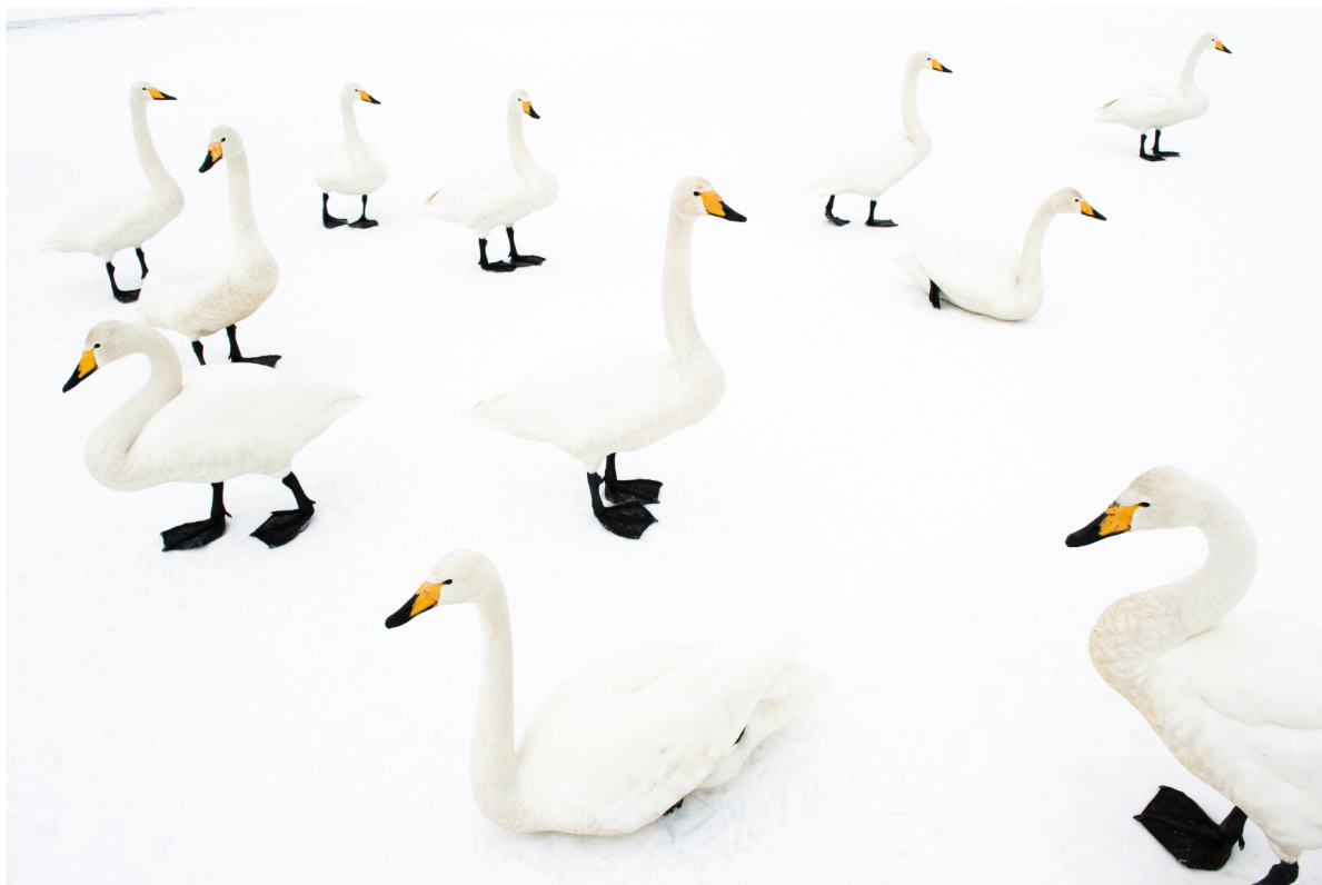
Cigni selvatici ( Cygnus cygnus ) | Hokkaido - Giappone

DICEMBRE 2013 | 1 2 3 4 5 6 7 8 9 10 11 12 13 14 15 16 17 18 19 20 21 22 23 24 25 26 27 28 29 30 31