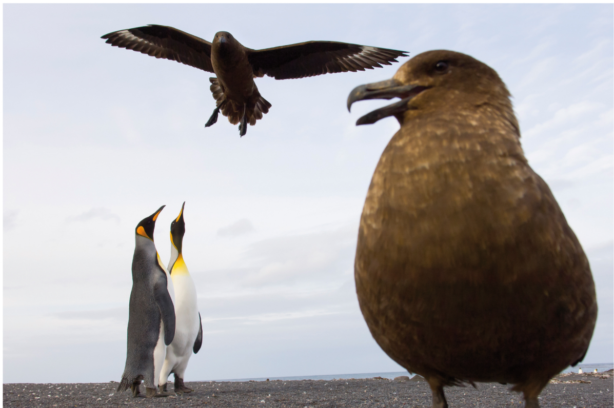
Pinguini reali ( Aptenodytes patagonicus ) - Stercorari bruni ( Catharacta lonnbergii ) | Crozet - Terre Australi e Antartiche Francesi

APRILE 2013 | 1 2 3 4 5 6 7 8 9 10 11 12 13 14 15 16 17 18 19 20 21 22 23 24 25 26 27 28 29 30