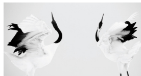
Gru della Manciuria ( Grus japonensis ) Hokkaido - Giappone