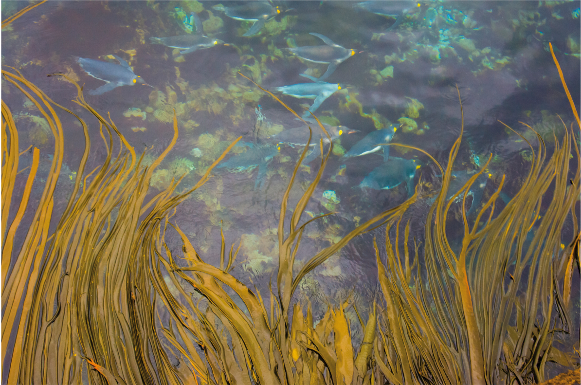
Pinguini reali ( Aptenodytes patagonicus ) | Crozet - Terre Australi e Antartiche Francesi

LUGLIO 2013 | 1 2 3 4 5 6 7 8 9 10 11 12 13 14 15 16 17 18 19 20 21 22 23 24 25 26 27 28 29 30 31