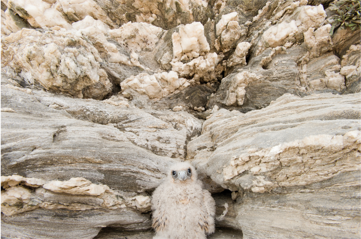
Falco della regina ( Falco eleonorae ) | Andros - Grecia

GIUGNO 2013 | 1 2 3 4 5 6 7 8 9 10 11 12 13 14 15 16 17 18 19 20 21 22 23 24 25 26 27 28 29 30