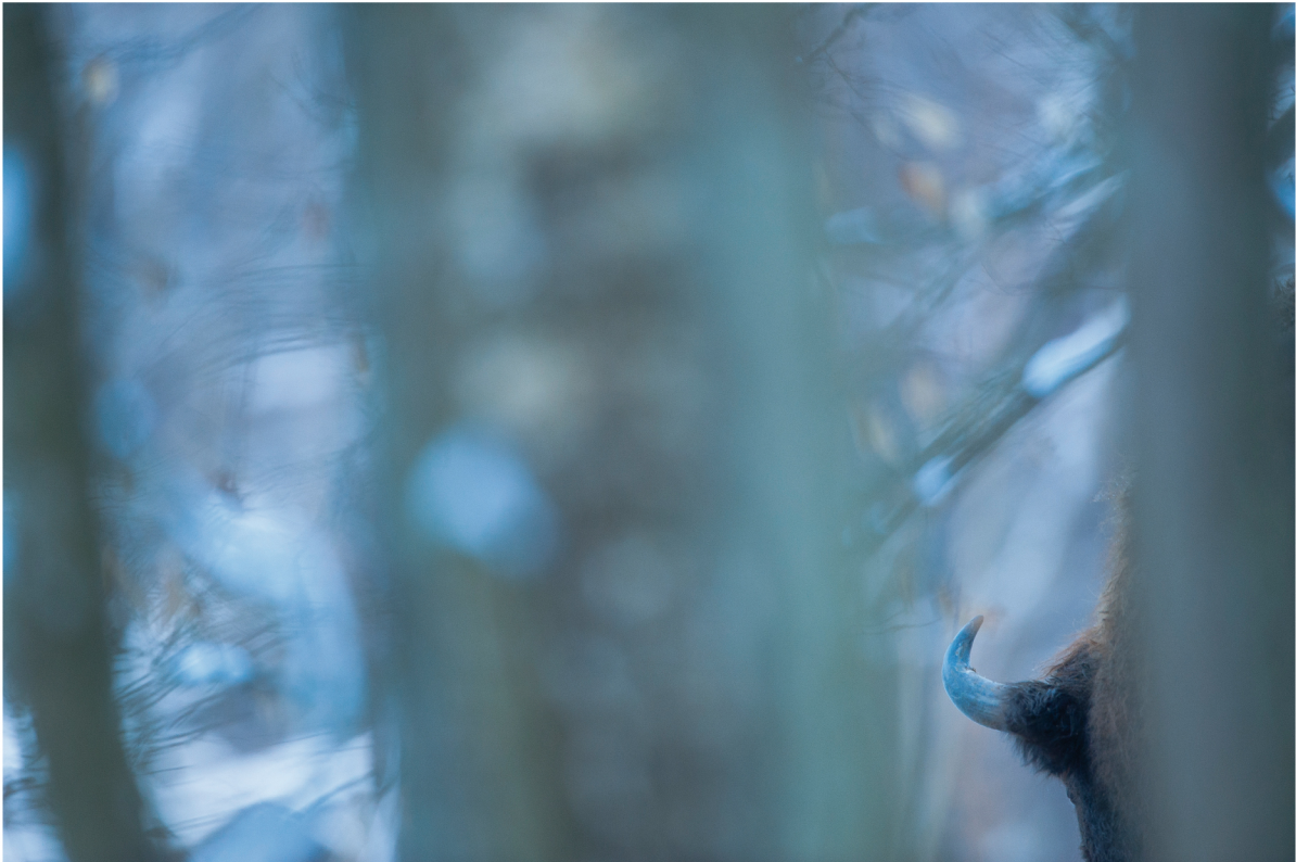
Bisonte europeo ( Bison bonasus ) | Białowieża · Polonia

OTTOBRE 2013 | 1 2 3 4 5 6 7 8 9 10 11 12 13 14 15 16 17 18 19 20 21 22 23 24 25 26 27 28 29 30 31