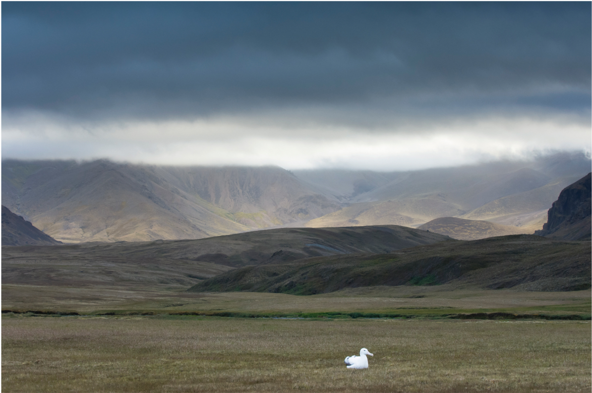
Albatro urlatore ( Diomedea exulans ) | Crozet - Terre Australi e Antartiche Francesi

SETTEMBRE 2013 | 1 2 3 4 5 6 7 8 9 10 11 12 13 14 15 16 17 18 19 20 21 22 23 24 25 26 27 28 29 30