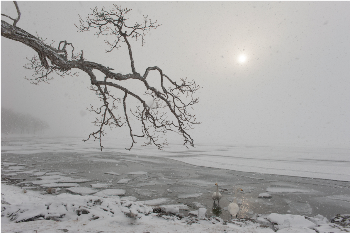
Cigni selvatici ( Cygnus cygnus ) | Hokkaido · Giappone

FEBBRAIO 2013 | 1 2 3 4 5 6 7 8 9 10 11 12 13 14 15 16 17 18 19 20 21 22 23 24 25 26 27 28