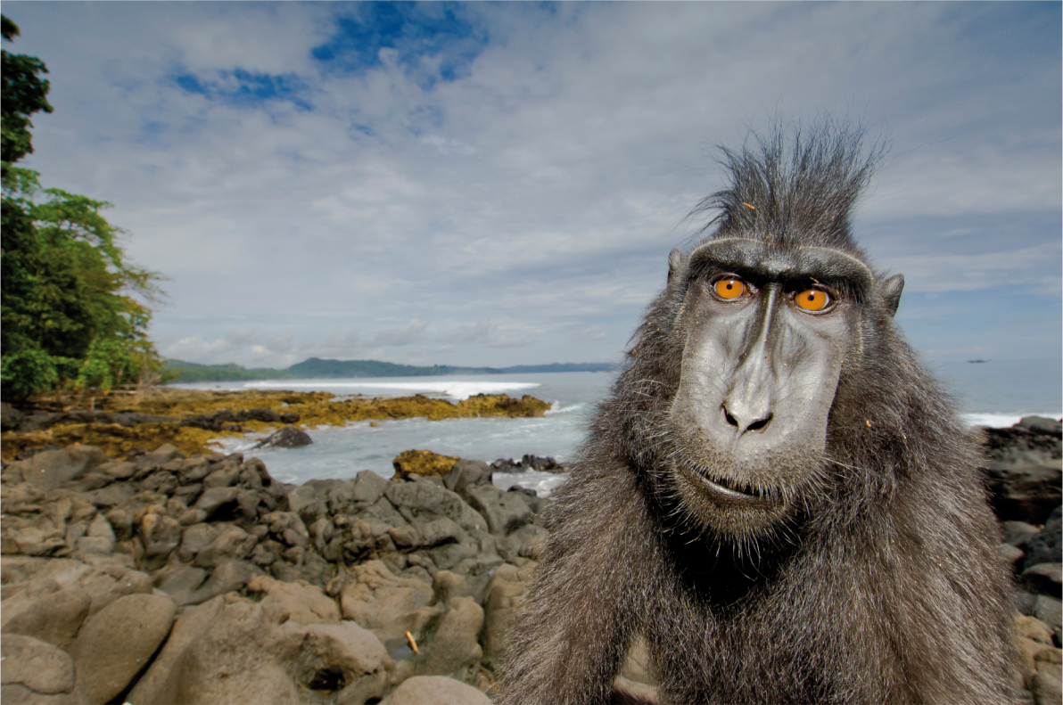
Cinopiteco ( Macaca nigra ) | Sulawesi - Indonesia

AGOSTO 2013 | 1 2 3 4 5 6 7 8 9 10 11 12 13 14 15 16 17 18 19 20 21 22 23 24 25 26 27 28 29 30 31