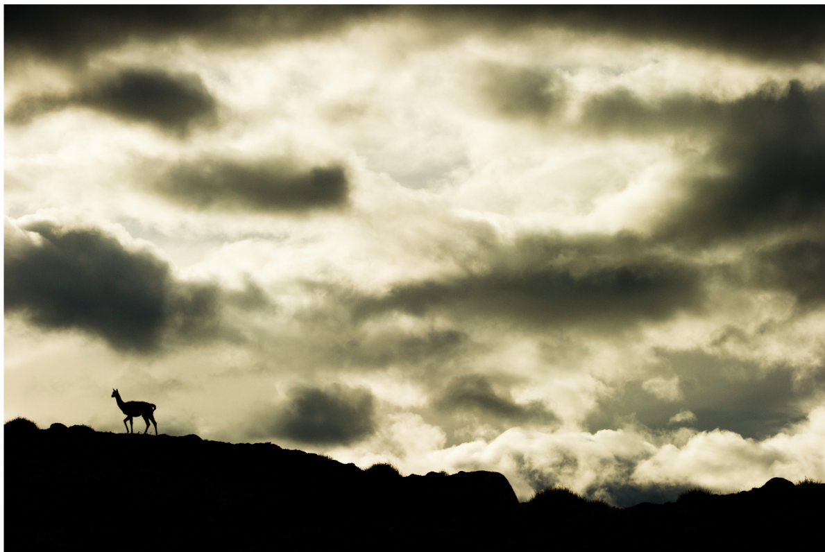
Guanaco ( Lama guanicoe ) | Torres del Paine - Chile

NOVEMBRE 2013 | 1 2 3 4 5 6 7 8 9 10 11 12 13 14 15 16 17 18 19 20 21 22 23 24 25 26 27 28 29 30