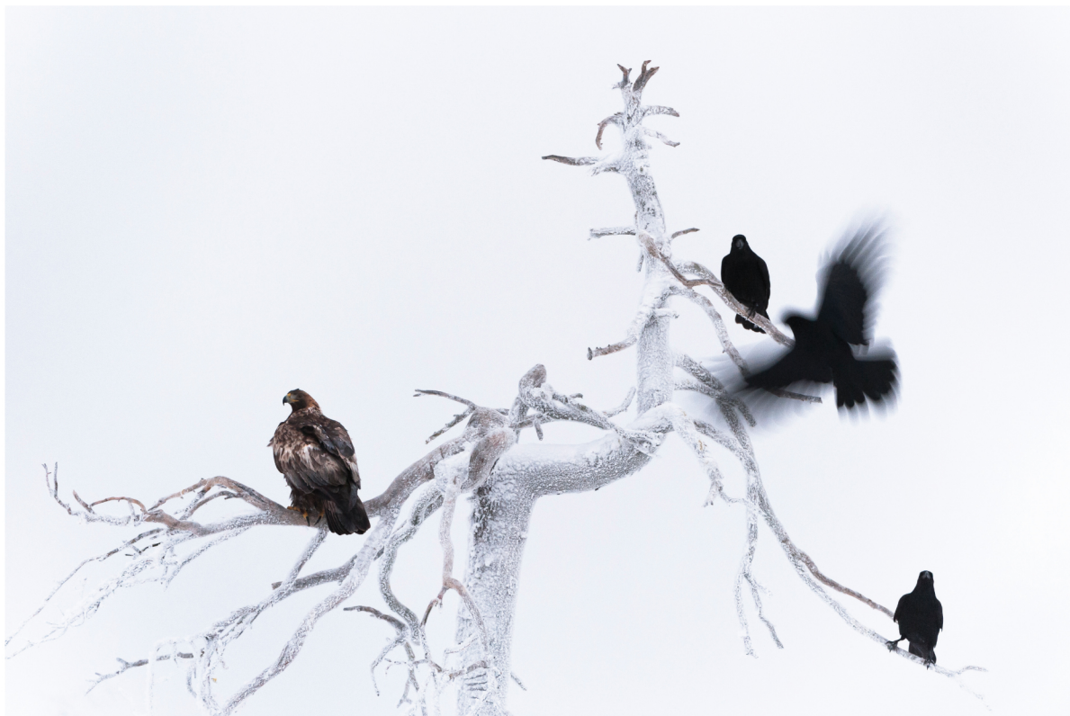
Aquila reale ( Aquila chrysaetos ) - Corvi imperiali ( Corvus corax ) | Kainuu - Finlandia

GENNAIO 2013 | 1 2 3 4 5 6 7 8 9 10 11 12 13 14 15 16 17 18 19 20 21 22 23 24 25 26 27 28 29 30 31