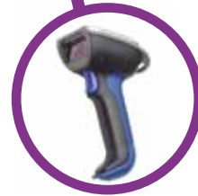
Leitor de códigos de barras