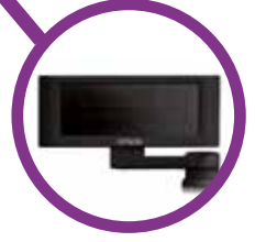
Ecrã do cliente