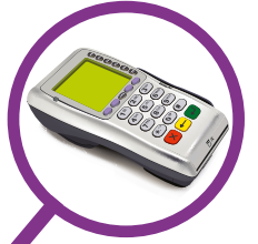
Terminale di pagamento

Dispositivo Intelligent (con funzioni di resilienza integrate)