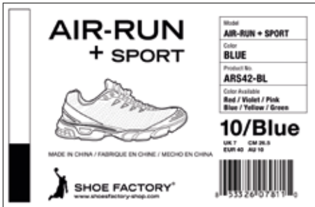
Bir Termal aktarım yazıcısıyla basılmış olan etiket