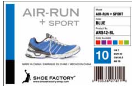
TM-C3500 ile basılmış olan etiket