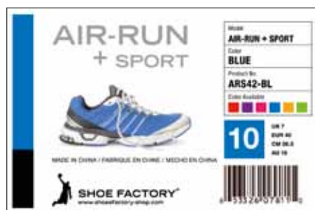
Štítek vytištěný pomocí tiskárny TM-C3500