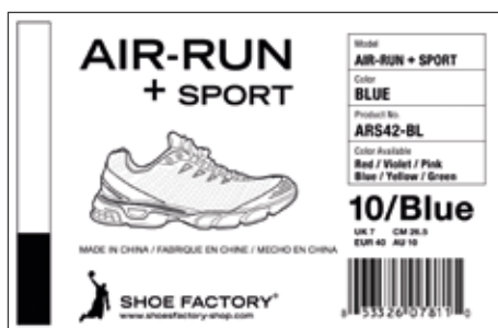
Štítek vytištěný pomocí termální tiskárny