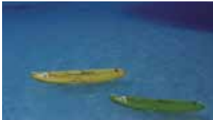
Sistema de un solo panel