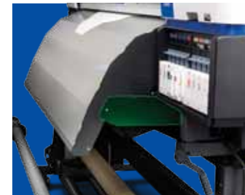
Ajustement du sécheur