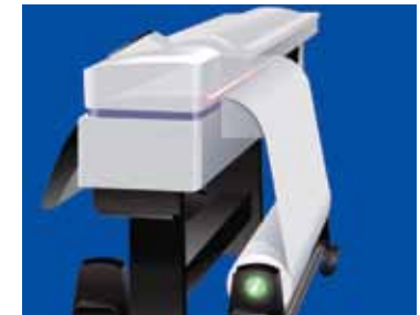
Système de tension automatique