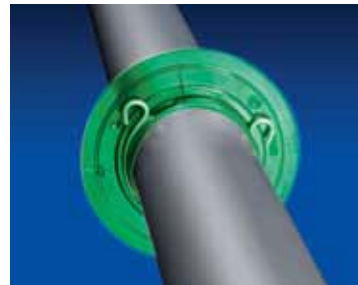
Guides de média

Rendez-vous sur le site www.epson.eu/surecoloracademy