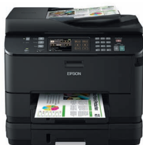
Epson WorkForce Pro WP-4545DTWF

Na požiadavky súčasného sveta obchodu reagujeme koncepciou, že ak požadovaný produkt neexistuje, vytvoríme ho.