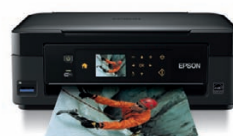
Epson Stylus SX440