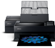
SureColor SC-P6000 / SC-P8000