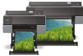
SureColor SC-P7500 / SC-P9500