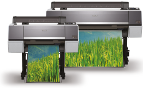
SureColor SC-P7000 / SC-P9000