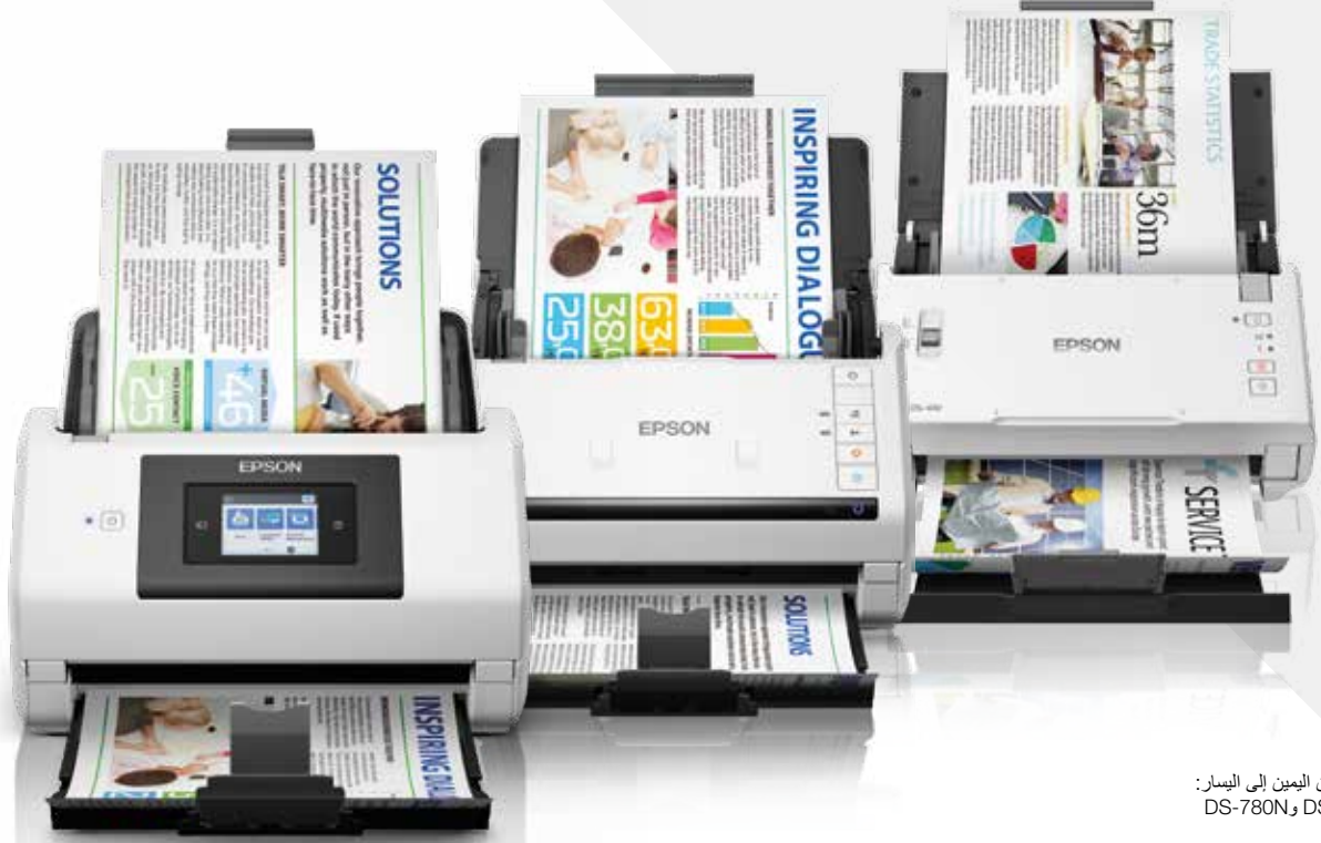
الطرز المعروضة من اليمين إلى اليسار: DS-780N و DS-530 و DS-410

يمكنك تهيئة بيئة عمل أفضل بدعم من شركة عالمية رائدة في مجال حلول المسح الضوئي. وتعتبر سلسلة الماسحات الضوئية للأعمال بنظام التغذية بالورق من إبسون الحل الأمثل للمكاتب المزدهمة وتطبيقات المكاتب الأمامية، وقد صُممت هذه الأجهزة خصيصاً لتحقيق أداء متميز.