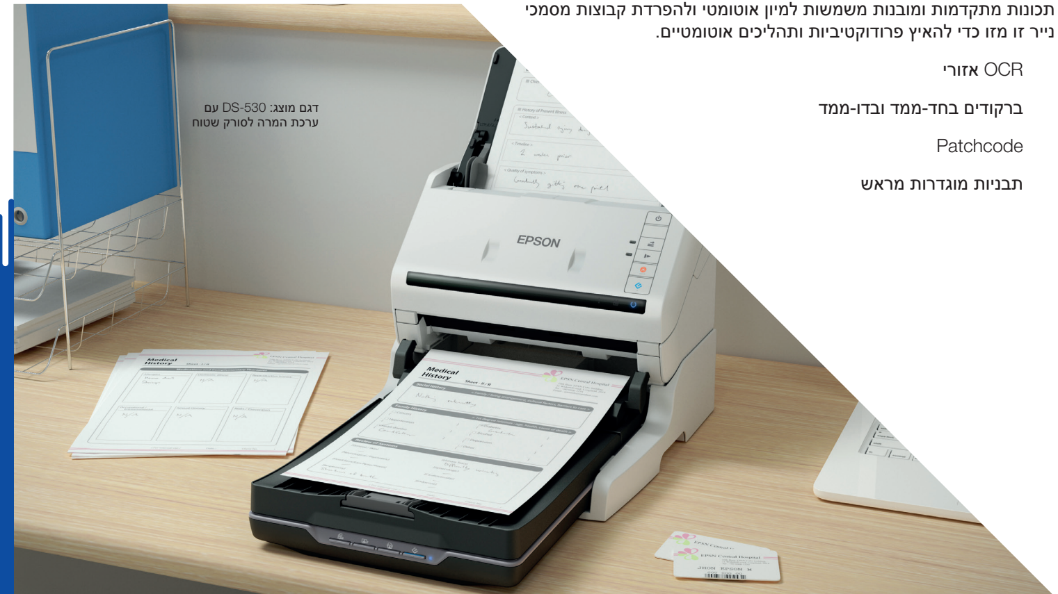
דגם מוצג: DS-530 עם ערכת המרה לסורק שטוח