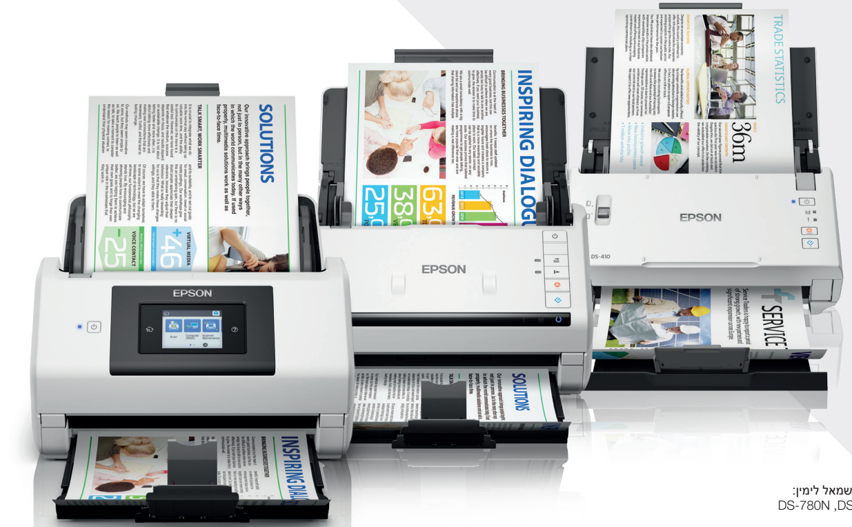
דגמים מוצגים משמאל לימין: DS-780N, DS-530, DS-410

יצירת סביבה עסקית טובה יותר עם התמיכה של מובילה עולמית בפתרונות סריקה. מגוון הסורקים עם מזיני הנייר של Epson בנו תוך התמקדות בביצועים ומהווים פתרון אידיאלי לסביבה משרדית עסוקה ולאפליקציות עבודה מול קהל.