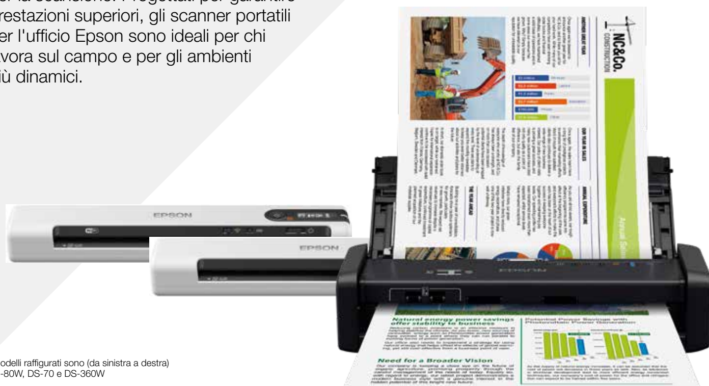
I modelli raffigurati sono (da sinistra a destra) DS-80W, DS-70 e DS-360W