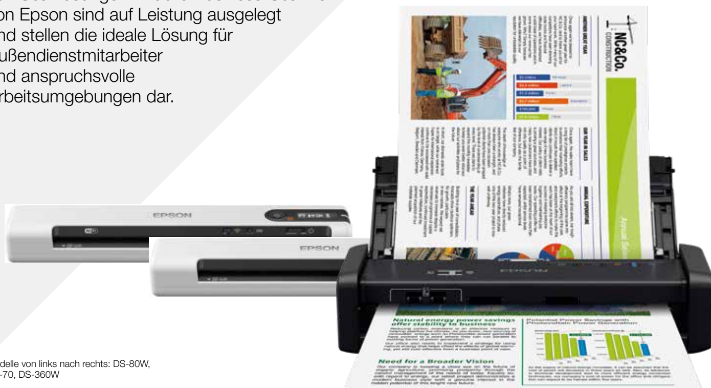
Modelle von links nach rechts: DS-80W, DS-70, DS-360W