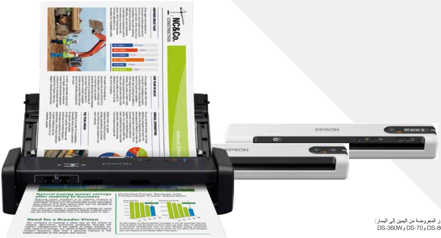
الطرز المعروضة من اليمين إلى اليسار: DS-360W و DS-70 و DS-80W

يمكنك إعداد مكتب متنقل بدعم من شركة عالمية رائدة في مجال حلول المسح الضوئي. وتعتبر سلسلة الماسحات الضوئية المتنقلة للأعمال من إيسون الحل الأمثل للعمال الميدانيين وبيئات العمل المرنة، وقد صُممت هذه الأجهزة خصيصًا لتحقيق أداء متميز.