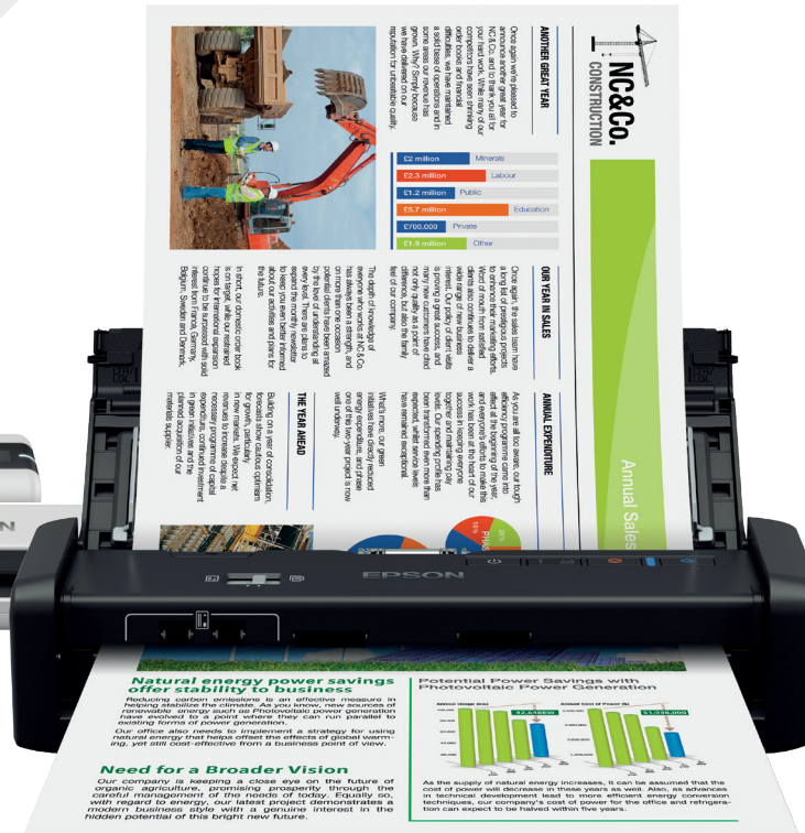
Weergegeven modellen van links naar rechts: DS-80W, DS-70, DS-360W