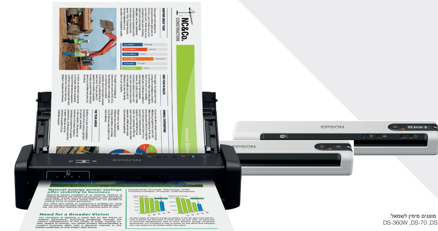
דגמים מוצגים מימין לשמאל: DS-360W, DS-70, DS-80W

יצירת משרד נייד עם התמיכה של מובילה עולמית בפתרונות סריקה. מגוון הסורקים העסקיים והניידים של Epson נבנו תוך התמקדות בביצועים ומהווים פתרון אידיאלי לעובדים הנמצאים בשטח ולסביבות עבודה הנדרשות לרזיזות.