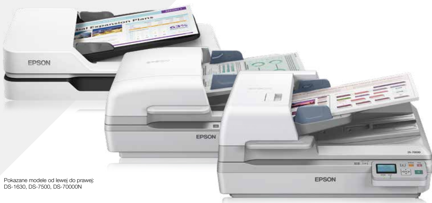
Pokazane modele od lewej do prawej: DS-1630, DS-7500, DS-7000N

Twórz lepsze środowisko biznesowe dzięki wsparciu światowego lidera rozwiązań do skanowania. Płaskie skanery biznesowe firmy Epson powstały z myślą o wydajności — są idealnym rozwiązaniem do skanowania dużych nakładów.