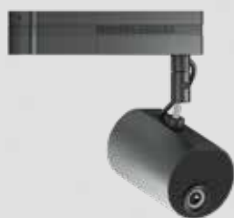
Montaje directo en el techo

Distintas opciones de instalación para facilitar las proyecciones y contar con mayor flexibilidad. Además del montaje directo estándar en el techo, es sencillo colocar el proyector sobre un carril de iluminación ya instalado con el soporte opcional o bien sobre la base opcional que permite proyectar desde el suelo.