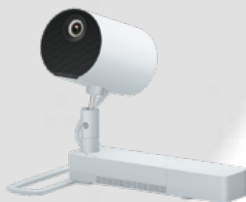
Base para el suelo