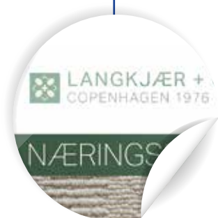
Prezentați sigla companiei în culorile mărcii