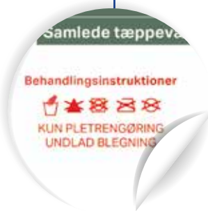
Evidențiați instrucțiunile de îngrijire cheie