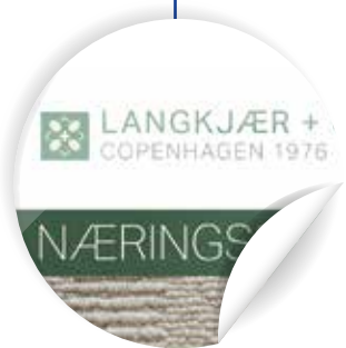
הצגת לוגו החברה בצבעים מלאים