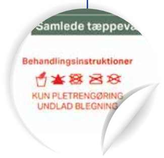
הדגשת פרטים מהותיים לאופן הטיפול