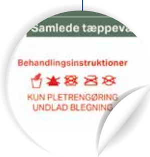
Fremhæv vigtige behandlingsinstruktioner