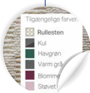
Angiv andre farver, der er tilgængelige i sortimentet