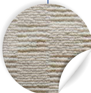
Zobrazení barvy a povrchové struktury produktu