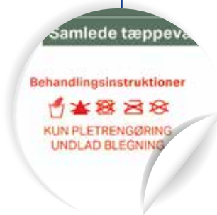
Zviditelnění důležitých pokynů k péči