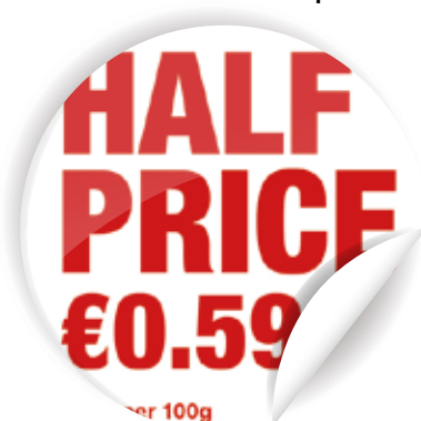
Lag iøynefallende spesialtilbud