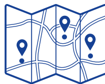
Skriv ut lokalt