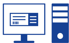
Lag etiketter sentralt

Unngå alle problemene knyttet til sentral utskrift av tusenvis av etiketter og dra nytte av fleksibiliteten ved å skrive ut lokalt, internt og ved behov.