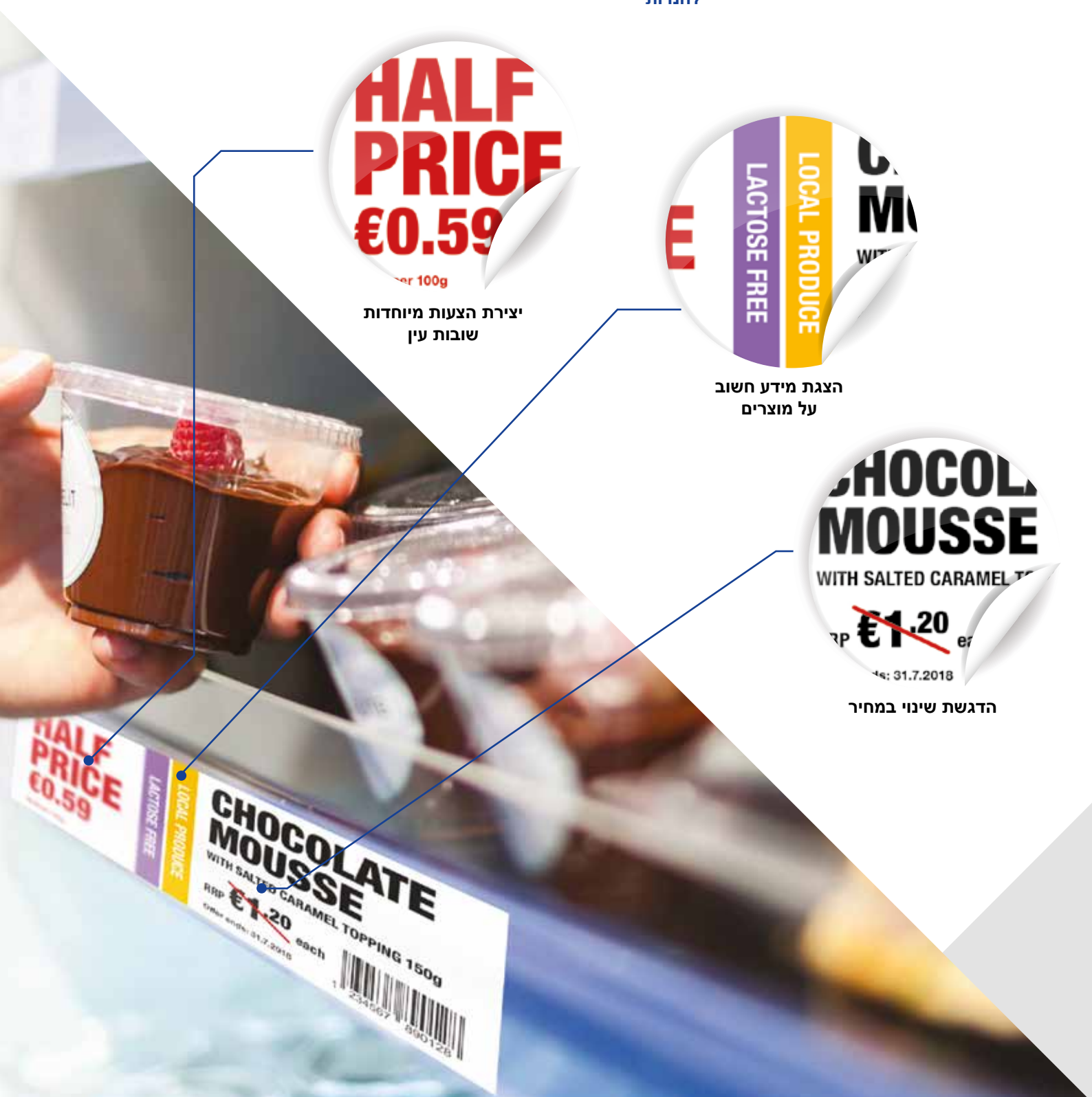
הדגשת שינוי במחיר