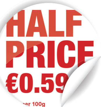
יצירת הצעות מיוחדות שובות עין

מדפסת מדבקות צבעוניות ואיכותיות, גמישה ובמחיר נוח מאפשרת להעביר את הפקת המדבקות לתיוג מדפים (SEL) אליך לעסק. בין אם אלה מדבקות עם סמלי לוגו צבעוניים, מבצעים או מידע חשוב על מוצרים, מדפסת מדבקות דינמית זו נותנת מענה לכל צרכי תיוג המדפים שלך.