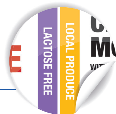
הצגת מידע חשוב על מוצרים