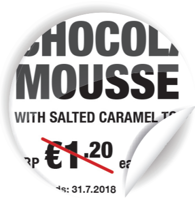
הדגשת שינוי במחיר