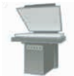
Trocknen der Vorbehandlungsflüssigkeit