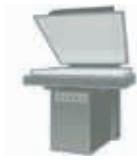
Trocknen der Tinte