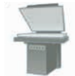
Trocknen der Tinte