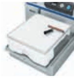
Entfernung von Fusseln und Glätten der Oberfläche