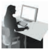
Opret et design