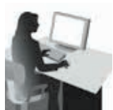
Opret et design