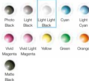
Světle světlá černá