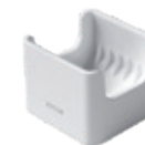
Brett til sendere