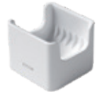
Lade voor zenders