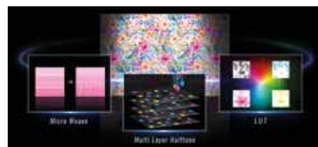
Τεχνολογία Precision Dot

Η μεγάλη κεφαλή εκτύπωσης 4,7 ιντσών PrecisionCore MicroTFP διαθέτει 3.200 ακροφύσια ανά κεφαλή και συνδυάζει 4 κεφαλές (6 κεφαλές για τον SC-F11000H). Η ενσωματωμένη τεχνολογία Precision Dot της Epson συνδυάζει τρεις εξειδικευμένες τεχνολογίες – Halftone, LUT και Micro Weave – για να προσφέρει ανώτερο φινίρισμα εκτύπωσης.