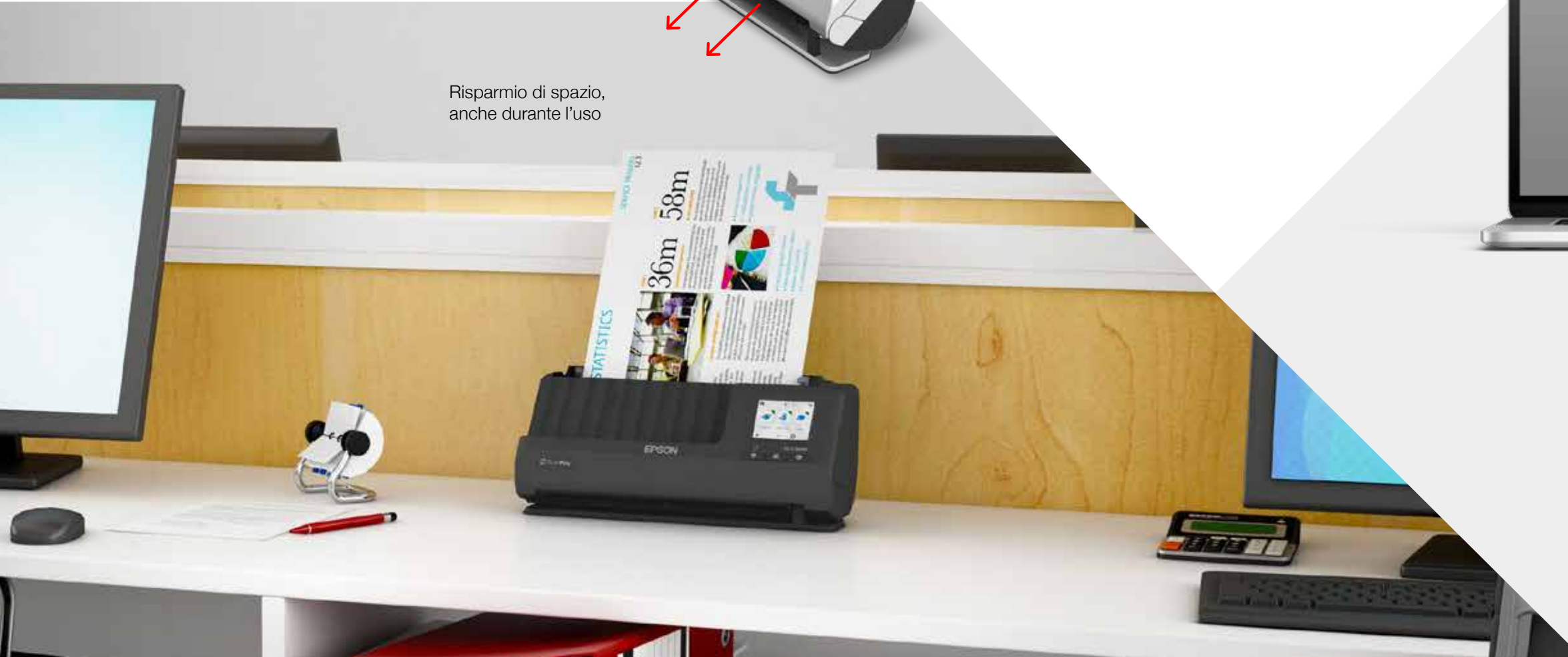
Risparmio di spazio, anche durante l'uso