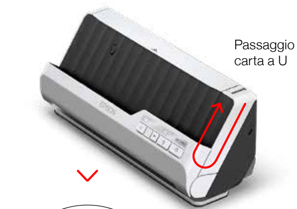
Passaggio carta a U

Nonostante le dimensioni compatte, lo scanner non scende a compromessi in fatto di prestazioni ed è dotato di funzioni che facilitano tutte le esigenze di scansione.