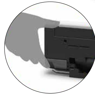
Facendo scorrere il pulsante di selezione della posizione si regola l'angolo dello scanner