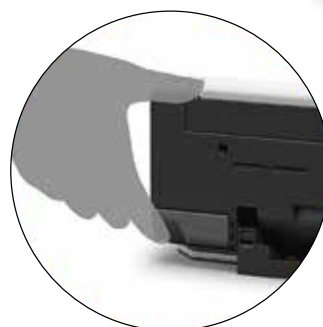
Durch Umschalten des Papierwegsalters wird der Winkel des Scanners eingestellt