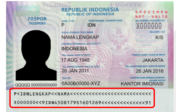
Data MRZ jsou načtena a je vytvořen náhled indexu

Software Document Capture Pro zaznamenává a indexuje všechny osobní údaje ze strojově čitelné oblasti pasu (MRZ) a cestovních dokladů (TD1) ve formátech kompatibilních s Excelem.