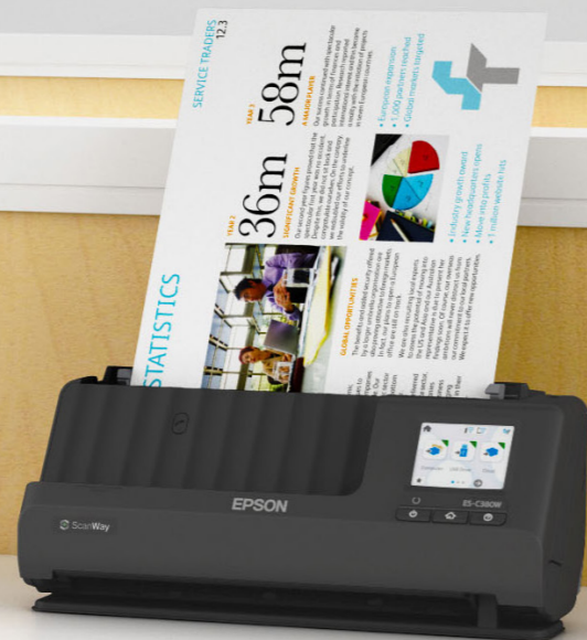
Úspora místa i při používání