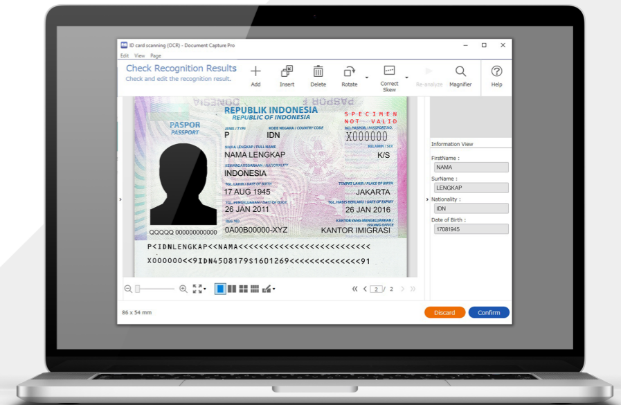
Dokument je poté exportován jako soubor .csv