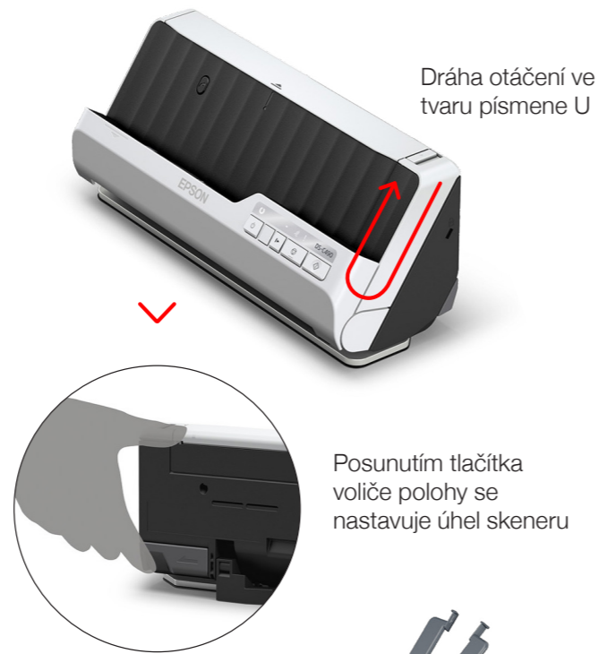
Dráha otáčení ve tvaru písmene U

I když je skener kompaktní velikosti, nedělá kompromisy ve výkonu a je vybaven funkcemi, které usnadňují všechny vaše skenovací úlohy.