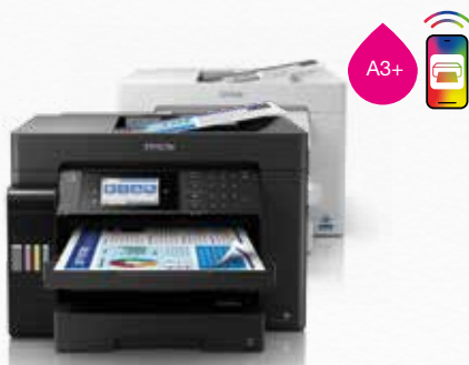
EcoTank ET-16600 -sarja

Nauti laadukkaasta tulostuksesta pigmenttimusteilla, jotka eivät tuhriinnu ja kestävät korostuskyniä. Suurten kosketusnäyttöjen ja älylaitteisiin muodostettavien langattomien yhteyksien ansiosta tässä EcoTank-sarjassa on kaikki tarvittava.