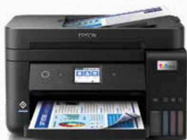
Pienille toimistoille ja kotitoimistoon

Mukana toimitettavalla musteella voi tulostaa jopa 11 000 sivua 3