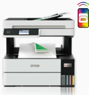
EcoTank ET-5100 -sarja Ihanteellinen etätyöskentelyyn

Tulostus, kopiointi ja skannaus ET-5170 mallissa myös faksi 250 arkin paperilokero 35 arkin automaattinen arkinsyöttölaite Liitännät: Wi-Fi, Wi-Fi Direct ja Ethernet Yhteensopiva Epson Smart Panel -sovelluksen kanssa Helppo mobiilitulostus Epson PrecisionCore -tekniikka 6,1 cm:n värikosketusnäyttö Yhden vuoden / 100 000 sivun takuu 17