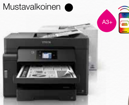
EcoTank ET-M16600 -sarja

Tulostus, kopiointi ja skannaus ET-M16680 mallissa PCL-tuki Huippunopea tulostus ja skannaus 2 x 250 arkin paperilokero (maks. A3), 50 arkin takasyöttö 50 arkin nopea arkinsyöttölaite Liitännät: Wi-Fi, Wi-Fi Direct ja Ethernet Yhteensopiva Epson Smart Panel -sovelluksen kanssa Helppo mobiilitulostus Epson PrecisionCore -tekniikka 6,8 cm värikosketusnäyttö Yhden vuoden / 150 000 sivun takuu 15