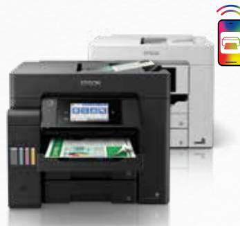
EcoTank ET-5800 -sarja

Tulostus, kopiointi, skannaus ja faksaus ET-5880 mallissa PCL-tuki Huippunopea tulostus ja skannaus 2 x 250 arkin paperilokero (maks. A4), 50 arkin takasyöttö 50 arkin nopea arkinsyöttölaite Liitännät: Wi-Fi, Wi-Fi Direct ja Ethernet Yhteensopiva Epson Smart Panel -sovelluksen kanssa Helppo mobiilitulostus Epson PrecisionCore -tekniikka 10,9 cm värikosketusnäyttö Yhden vuoden / 150 000 sivun takuu 15