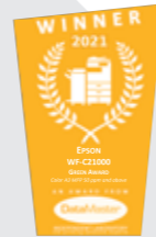
DataMaster Lab Green Award 2021 Epson WF-C21000

Ottieni sempre immagini di elevata qualità stampando con velocità fino a 100 ppm. Compatibili con i software più avanzati e in grado di offrire una maggiore sicurezza, i multifunzione Epson WorkForce Enterprise forniscono a ogni stampa un'elevata versatilità e prestazioni straordinarie.