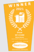
Premio Green Award de DataMaster Lab en 2021 Epson WF-C21000

Imprime hasta 120 000 páginas en monocromo sin reponer la tinta 2 . Gracias a los cartuchos de tinta DURABrite Pro, nuestra serie en color imprime hasta 100 000 páginas en monocromo y 50 000 en color sin necesidad de cambiar consumibles 3 . El menor reemplazo de consumibles reduce los desperdicios y permite una menor intervención por parte del usuario.