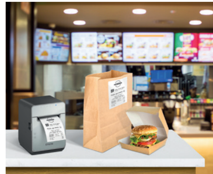
Stravovanie a ubytovanie (QSR)