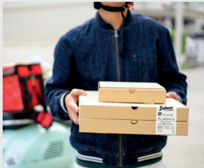
Plats à emporter