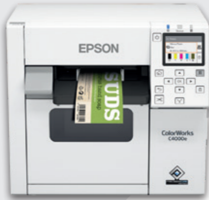
ColorWorks C4000e Serisi