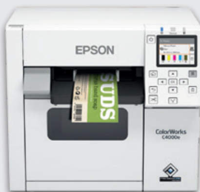
ColorWorks serie C4000e