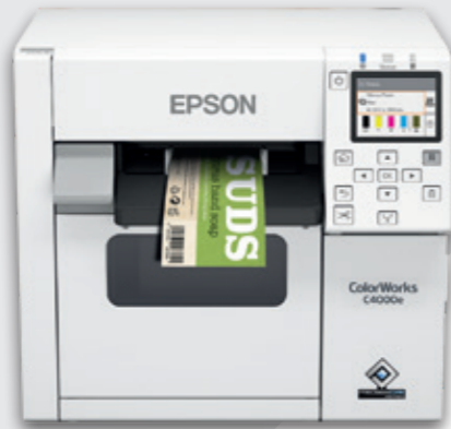
Řada ColorWorks C4000e