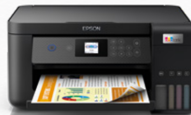
Imprimantes pour les particuliers

Le système de remplissage de l'encre réduit les risques de fuite grâce aux bouteilles faciles à ouvrir et dotées d'un système de pressurisation de l'air. Il n'est donc plus nécessaire d'appuyer sur les bouteilles lors du processus de remplissage. Les bouteilles sont également équipées de détrompeurs garantissant que chaque réservoir est rempli avec la bonne couleur.