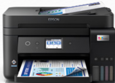
Imprimantes pour les professionnels

Fournie avec suffisamment d'encre pour imprimer jusqu'à