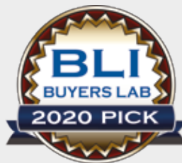
Epson EcoTank ET-5880 Outstanding SOHO Colour Inkjet All-in-One

Epson EcoTank ET-5880 on saanut "Erinomainen" -maininnan BLI Summer 2020 Pick Award -kategoriassa kotitoimistojen ja pienten toimistojen mustesuihkutekniikkaa käyttävät värimonitoimitulostimet.