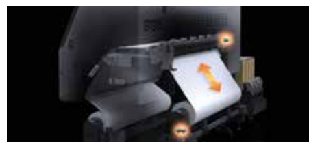
Riadenie automatického napnutia materiálu

Konzistentná, vysokokvalitná tlač je výsledkom vysokej presnosti podávania predlôh. Pokročilé riadenie automatického napnutia materiálu (Ad-ATC) prináša stabilné podávanie vďaka synchronizácii motoru podávača a pohonu kotúča. Tým sa minimalizujú negatívne dôsledky spôsobené zmenami hmotnosti predlohy, tvaru jadra kotúča, priemeru alebo príhnavosti predlohy.