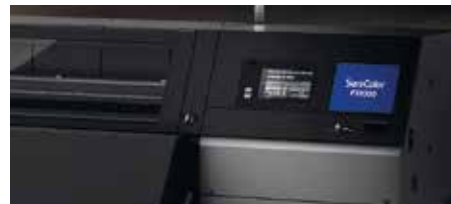
Kovové vonkajšie panely

Priemyselný priestor je vzácny, takže rozmery tlačiarňí SC-F10000 a SC-F10000H sú takmer o polovicu menšie ako pri niektorých konkurenčných tlačiarňach, a vonkajšie kovové panely zabezpečujú, že tlačiarne sú dostatočne odolné, aby zabezpečili prácu v najnáročnejších priemyselných prostrediach.