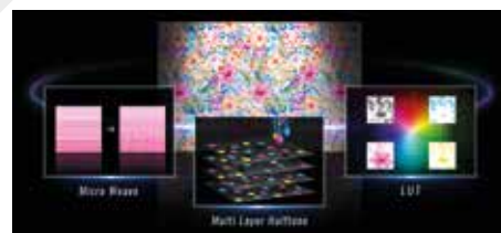
Technológia Precision Dot

Široká tlačová hlava PrecisionCore MicroTFP má 3 200 dýz na hlavu a kombinuje 4 hlavy (6 hláv tlačiarne SC-F10000H). 4,7-palcová šírka umožňuje tlač na veľké povrchy. Zabudovaná technológia Epson Precision Dot kombinuje tri špecializované technológie – Halftone, LUT a Micro Weave – na dosiahnutie vynikajúcej kvality tlače.