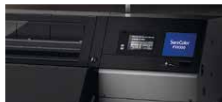
Panneaux extérieurs métalliques

L'espace industriel est précieux, c'est pourquoi l'empreinte au sol des SC-F10000 et SC-F10000H est presque réduite de moitié en comparaison de certaines imprimantes concurrentes. Les panneaux extérieurs en métal garantissent une robustesse suffisante pour travailler dans les environnements industriels les plus difficiles.