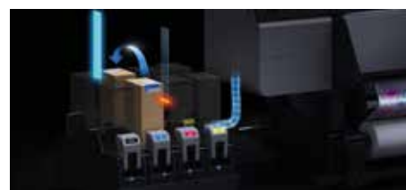
Fonction de « remplacement à la volée »

Une productivité élevée nécessite une disponibilité maximale. Les imprimantes bénéficient de notre solution de gros encrage, vous offrant une flexibilité totale avec un double pack d'encre de 3 litres ou 10 litres, ou une combinaison des deux tailles. Le système utilise la fonction de « remplacement à la volée » d'Epson, conçue pour vous permettre de fonctionner sans interruption. La machine effectue automatiquement le passage entre les packs d'encre et vous avertit via le panneau de contrôle et via le Production Monitor lorsque vous devez remplacer les consommables d'encre qui sont vides.