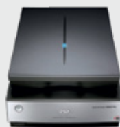
Perfection V850 Pro